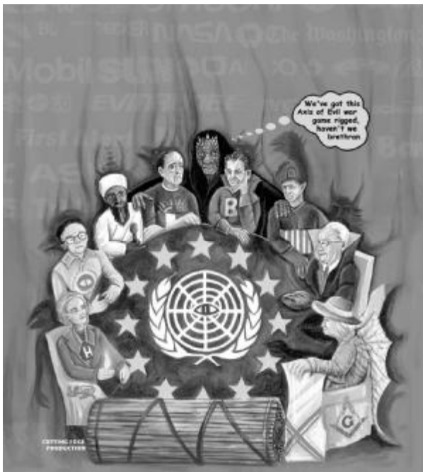
Obr. 79: Tajní agenti a loutky iluminátů za scénou, kteří se často tváří, že stojí na opačných „stranách“, pracují společně na tom, aby zavedli globální centralizovaný stát. Někteří tak dělají vědomě, zatímco konání jiných je zmanipulované bez pochopení všech důsledků jejich činů.

na lidi. Podobně to samozřejmě dělá i, alespoň ve většině případů, program Strach o přežití potomka, jako příklad se Šedou velrybou, mezi miliony jiných. Kontrola a ovládnutí informací, které lidé absorbují, je pro Matrix rozhodující, protože vědomí musí být udrženo v iluzi za každou cenu. Dříve jsem užíval analogie s míčkem plovoucím na hladině nádrže s vodou. To je jeho přirozený stav, plavat na povrchu a pokoušet se ho udržet na dně vyžaduje neustále úsilí. V momentě kdy ho pustíte šup, a je zase zpátky na hladině, protože to je jeho prvotní/hlavní realita. Stejně je to s vědomím. Pokud jej nebombardujete hypnotickými zprávami, abyste mu implantovali iluzi, odvrátí se, neboli jazykem počítačů přejde do „default“ svého počátečního stavu – Jednoty ve vědomí si sebe sama. Vzdělávací systém či program „Stroj na klobásky“ je důležitou součástí této hypnózy. „Vzdělávací“ program je kódovaný třemi hlavními cíly: